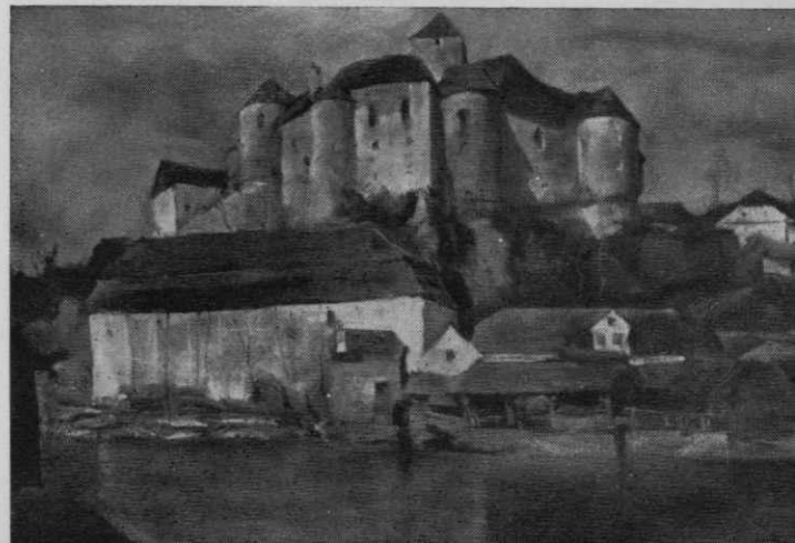
Žužemberški grad, pod njim nekdanji mlin za papir (ok. 1716 — ok. 1870), oz. poznejša usnjarna (B. Jakac, pastel, 1956)